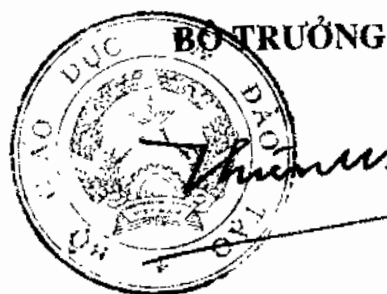
Nguyễn Thiện Nhân